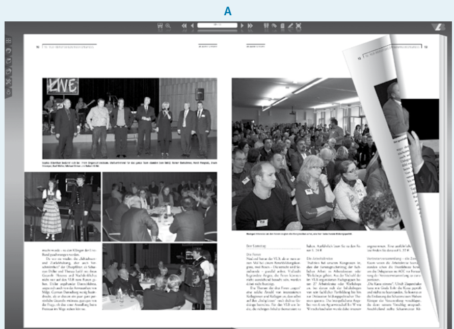
Die vlb-akzente im Vollbildmodus mit gerade angewählter Funktion „Umlblättern“ und den ansteuerbaren Navigationsleisten am Bildschirmrand oben und links.