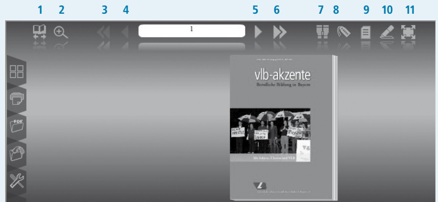
Detailansicht der vlb-akzente auf der Website VLB-online mit den Navigationsleisten oben und links.